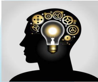
Raising awareness Direct and indirect effects

We say what we do, we do what we say, and we write it down.