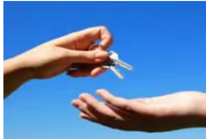
Trust and empowerment