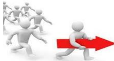
Everyone involved, everyone trained, everyone committed and everyone tested.